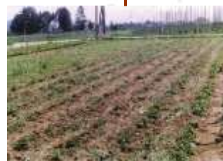
Vrt zdravilnih rastlin za šolo (1983).