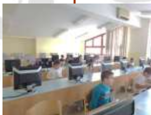
Sodobna računalniška učilnica.

Spopadli smo se s pandemsko gripo. V prostorih šole smo uredili dodatne prostore vrtca in novo računalniško učilnico. Uredili smo prometni režim v okolici šole. Obeležili smo 30 let raziskovalnih nalog na šoli.