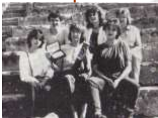
Grčija - gledališče v Epidaurosu, kjer je tedanja uredniška ekipa prejela zlato plaketo za glasilo.

Za šolsko glasilo so prejeli prvo zvezno nagrado v okviru takratne Jugoslavije. Na turističnem festivalu Turizmu pomaga lastna glava so prejeli prvo nagrado.