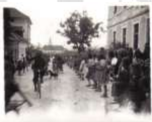
Nemška vojska je zasedla Polzelo (1941).

13. 5. 1945 je nemška vojska zapustila Polzelo; izpraznili so obe poslopji in ju pustili v velikem neredu. 15. maja so začeli urejati šolo - zakopavati jarke, odstranjevati bombe in mine, urejati šolski vrt (zaradi pomanjkanja hrane). 22. 5. 1945 so kljub pomanjkanju šolskih klopi začeli s poukom.