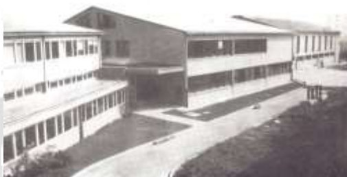
Šola se je poimenovala po Veri Šlander (1971).