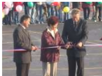
Odprtje novega športno-rekreacijskega centra za šolskim poslopjem (2005).

Obnova ravne strehe na prizidku, izgradnja posebnega vhoda in obnova prostorov za prvošolce. Pridobitev dodatne zelenice pri šoli. Šola že drugo leto sodeluje v državnem projektu ŠR, Mreža učečih se šol. Šola in vrtec sta vključena v državni inovacijski projekt ZRSS.