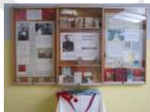
Pobudnik bralne značke Stanka Kotnik ima tudi polzelske korenine.