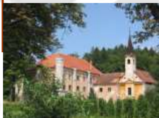
Novi klošter (2005)

Šola se preseli v bližnjo mežnarijo, ki je večkrat obnovljena oz. dozidana. Medtem potekajo priprave za izgradnjo novega šolskega poslopja.