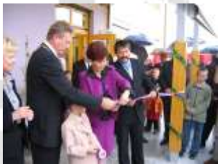
Odprtje nove šole v Andražu (2004).