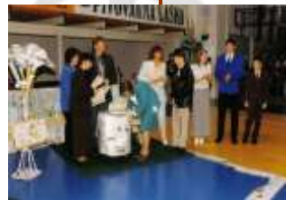
Svečani podpis ekolistine (1999).