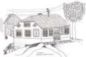
Tavčarjeva hiša (Matej Poteko, 1982/83 in foto 2006)