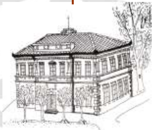
Nova šola (Matej Podbregar, 1982/83)