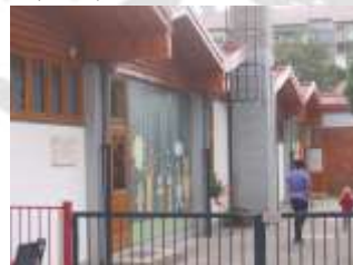
Vrtec postane enota šole (1999).