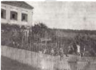
Delo na šolskem vrtu (1935).

Nemška vojska je zasedla šolska poslopja (staro in novo šolo), zato se je pouk odvijal v prostorih gostilne Cizej in Štefančič. 23. 4. pride v šolo prvi nemški učitelj, slovenski učitelji so morali v zapor, nekateri tudi v izgnanstvo v Srbijo.