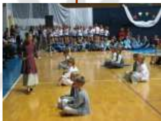
Pripravili smo pester kulturni program.

Pred šolo smo postavili kip Vzkliko je seme, delo učenca Domna Kandutija.