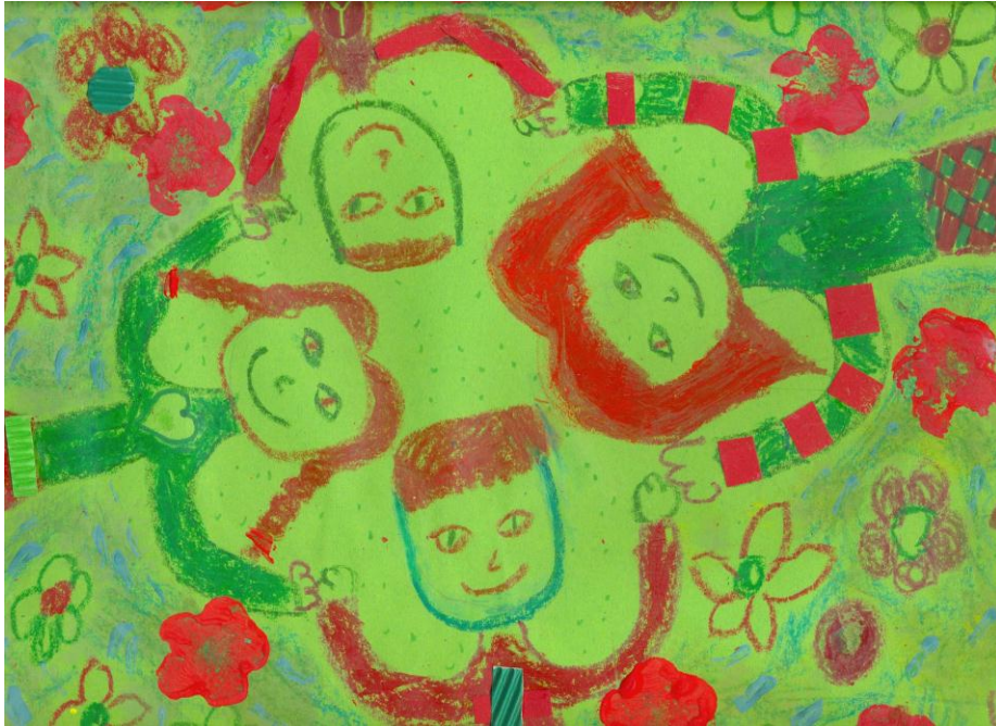
Lea Cvetko, 6. c

Odprto, varno in živo okolje za optimalen razvoj vsakega posameznika, moralnih vrednot in veščin vseživljenjskega učenja ... Usmerjeno k odličnosti.