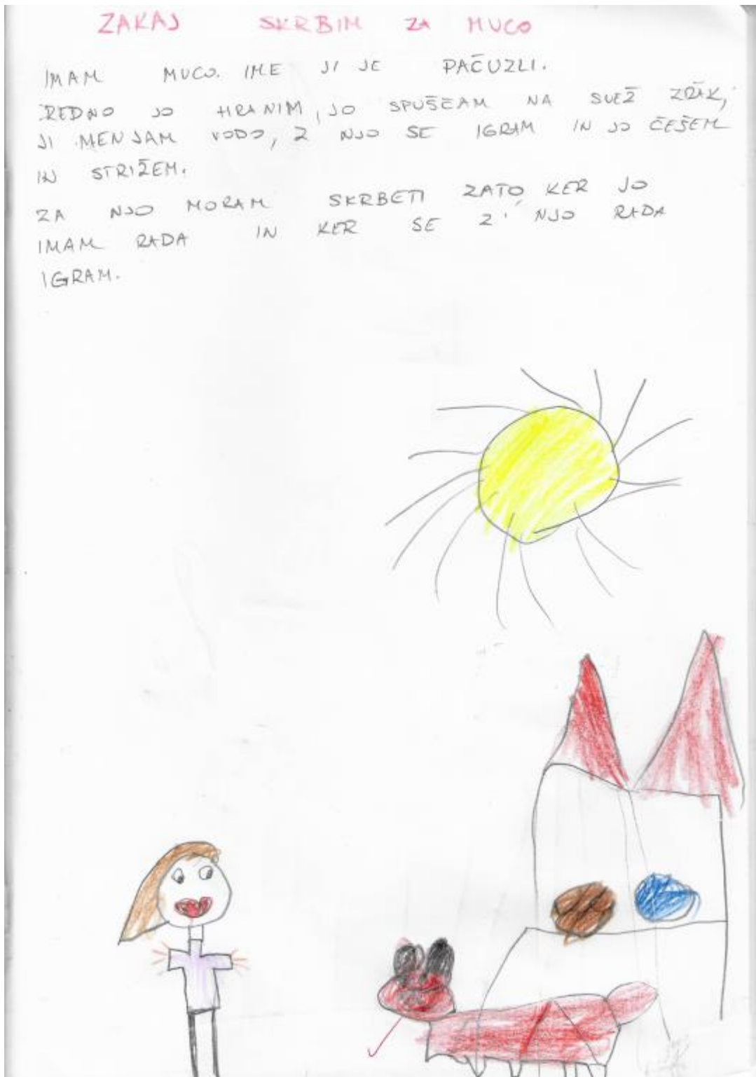
Sofia Zabukovnik, 1. d