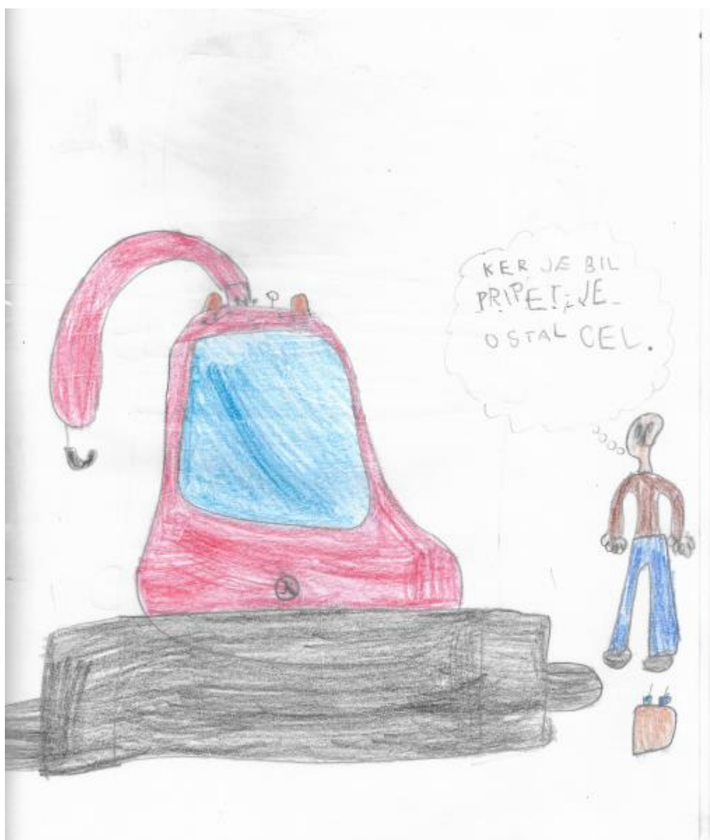
Liam Ograjšek, 1. d