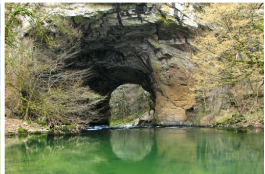
Naravni most v Rakovem Škocjanu