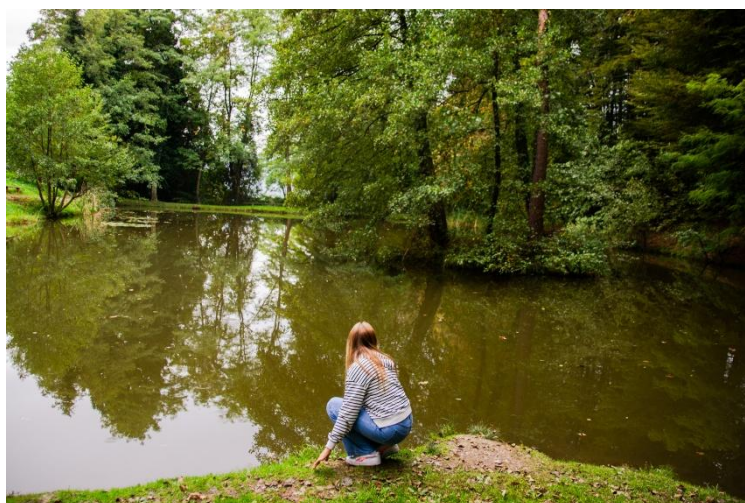
Slika 1: Skrivnostno jezero Tajht

Pripoved, ki nam jo je zaupala starejša gospa iz Polzele, njej jo je pripovedovala njena stara mama.